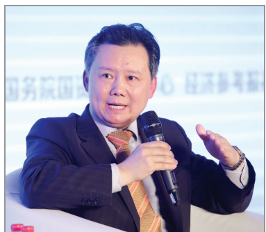
本报讯 2月23日,首届中国企业发展论坛在京隆重举行。国务院国资委主任肖亚庆在主旨演讲中,就当前经济新常态下,国有企业改革发展的新阶段,在重点领域和关键环节尽快取得新的进展和突破,深入推进公司制股份制混合所有制改革、切实建立灵活高效的现代化经营机制、不断加大推进供给侧结构性改革力度、以管资本为主坚决转变国资监管职能、全面从严加强国有企业党的建设。

委主任肖亚庆致辞并作主旨演讲。国务院国资委副主任张喜武致闭幕词。集团董事长、党委书记马正武出席论坛,并参加“优化供给侧圆桌对话”。